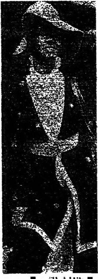
باغايا في احدى المناسبات

في اول حديث صحفي اعلنت به الازايبت باغايا وزيرة خارجية اوغندا السابقة ، نعت جميع التهم التي وجهت اليها والشهيرة بتهمة الممارسات «الصبي» في دورة مياه مطار اولي . في حين قال اصقلاها ، ان السبب الرئيسي للثورة الرئيس الكونغندي عليها ، هو انه طلب يدها بسراراً ورفضت . ونشرت الحديث صحيفة «الديلي اكسبريس» اللندنية ، تالفة انغويديا تالفة الازايبت السابقة نعت جميع التهم التي وجهت اليها والشهيرة بتهمة الممارسات «الصبي» في دورة مياه مطار اولي . في حين قال اصقلاها ، ان السبب الرئيسي للثورة الرئيس الكونغندي عليها ، هو انه طلب يدها بسراراً ورفضت . ونشرت الحديث صحيفة «الديلي اكسبريس» اللندنية ، تالفة انغويديا تالفة الازايبت السابقة نعت جميع التهم التي وجهت اليها والشهيرة بتهمة الممارسات «الصبي» في دورة مياه مطار اولي . في حين قال اصقلاها ، ان السبب الرئيسي للثورة الرئيس الكونغندي عليها ، هو انه طلب يدها بسراراً ورفضت .